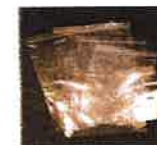
Sachet de Congélation à Zip